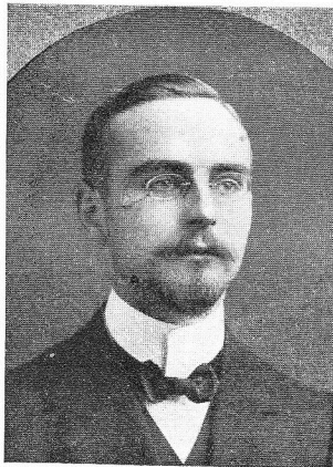
TELLIER, Maurice, né le 20 mars 1891, à Solre-sur-Sambre. Médecin adjoint, 2 e rég. chasseurs, Or. C., Cr. de G. S'est toujours fait remarquer par son courage et son dévouement à toute épreuve; frappé d'une balle de mitrailleuse, à Ramscapelle, le 20 oct 1915; mourut, à l'ambulance "Océan", à La Panne.