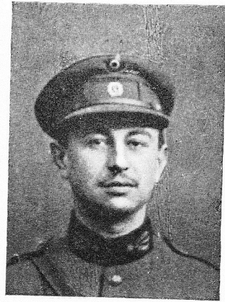
POTVIN, Marcel, né le 29 novembre 1892, à Braine-le-Comte. Médecin auxiliaire, 4 e Lanciers, Ord. Léop., Croix de Guerre. Après une carrière vaillamment remplie, fut frappé d'une balle en plein front, le 18 mars 1917, à Stuyvekenskerke; évacué sur l'ambulance "L'Océan", à La Panne, y mourut le même jour.